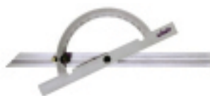
CÓDIGO 86465 | TRANSPORTADOR 200 X 400 C/CORREDERA CROMO MATE